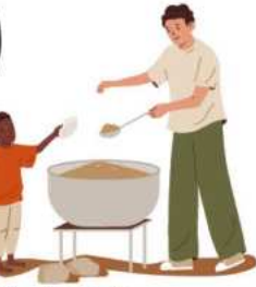
Açlıkla Mücadele Haftası