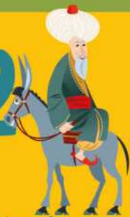
Nasreddin Hoca'nın vefatı