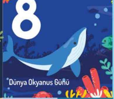
Dünya Okyanus Günü