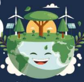
Dünya Çevre Günü