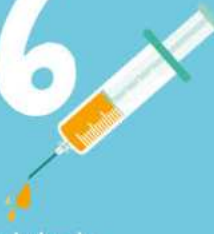
Verem aşısı bulundu