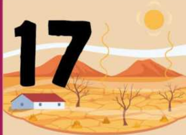
Dünya Çölleşme ve Kuraklıkla Mücadele Günü