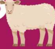
Kurban Bayramı'nın 1. günü Bayramınız Mübarek Olsun!