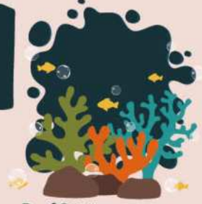
Dünya Resif Günü