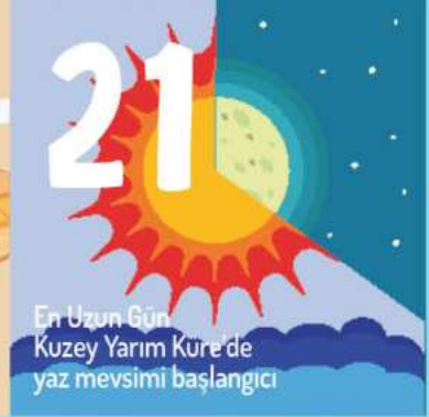
En Uzun Gün Kuzey Yarım Küre'de yaz mevsimi başlangıcı